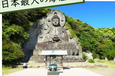
日本最大の摩崖仏